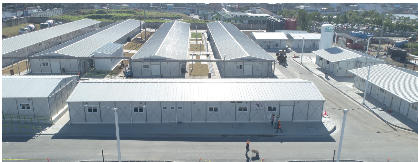
Modulares, Zona 11

En soporte a la respuesta de emergencia desplegada por el Instituto Guatemalteco de Seguridad Social (IGSS) para atender la pandemia COVID-19, en el marco del Programa INFRAIGSS, UNOPS brindó asistencia al Seguro en la compra de dos unidades modulares temporales para atención a pacientes con COVID-19 .